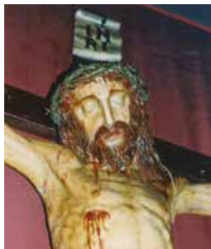
Crocifisso del Pilastrello particolare, 1998