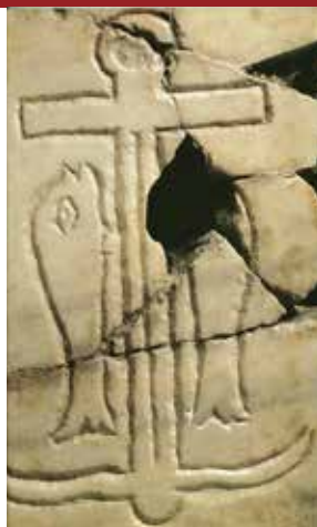
Ancora e pesce (Catacombe di Roma)

La croce è rappresentata da sola, senza l'immagine di Gesù, come uno splendente oggetto d'oro, incastonato di gemme. E' alla fine del IV secolo, in uno scritto di S. Ambrogio, che si fissa la tradizione della "invenzione" (scoperta) della vera croce da parte di Sant'Elena, madre di Costantino.