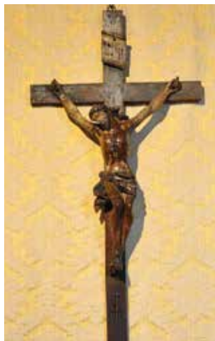
Il Crocifisso ligneo del '700