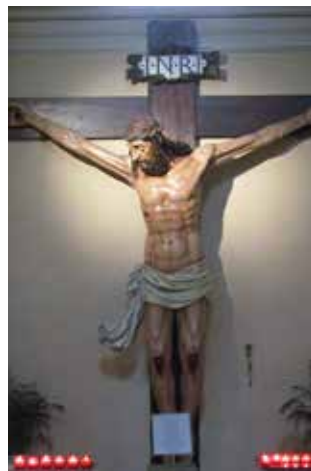
Gigantesco Crocifisso Sec. XVII - Cusano

Oltre a quella del Pilastrello, tra le croci più significative presenti nelle chiese della nostra Città ricordiamo le tre di Cassina Amata (secoli XVI, XVII e XVIII), le due di Dugnano (secolo XVII e XVIII) e quella recente di Oreste Riva, scultore palazzolese (santuario di Palazzolo, anni 80 del Novecento), rappresentante un Crocifisso trionfante. Per non limitarci al nostro "orticello" presentiamo la gigantesca croce del Santuario della Madonna della Cintura di Cusano (originariamente chiesetta del Pilastrello).