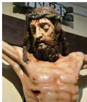
Crocifisso di Cusano , particolare

Vieni nel tuo splendor mite, siccome Il dì che andasti placido sul mare: Il popol vieni, Amico, a consolare, Che mal si segna nel tuo santo nome.