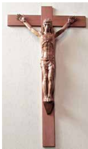
I Crocifissi di Dugnano , chiesa dei SS. Nazaro e Celso