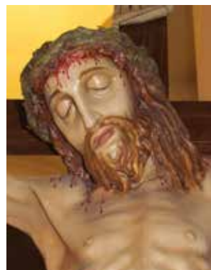
Crocifisso del Pilastrello, part. attuale cromia