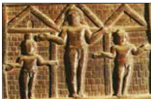
Cristo e i ladroni , S. Sabina - Roma

Alcune rare immagini del IV secolo contraddicono la ripugnanza iniziale dei cristiani a mostrare Cristo in croce. Si veda ad esempio un avorio conservato a Londra (con croce ben evidente) e un particolare della porta di cedro della basilica di S. Sabina a Roma, dove si vede Cristo nella posizione di un crocifisso ma non c'è la croce.