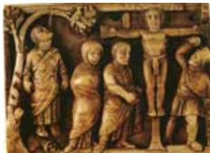
Cristo in croce , avorio - Londra