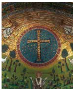
Croce Gemmata (S. Apollinare Nuovo - Ravenna)