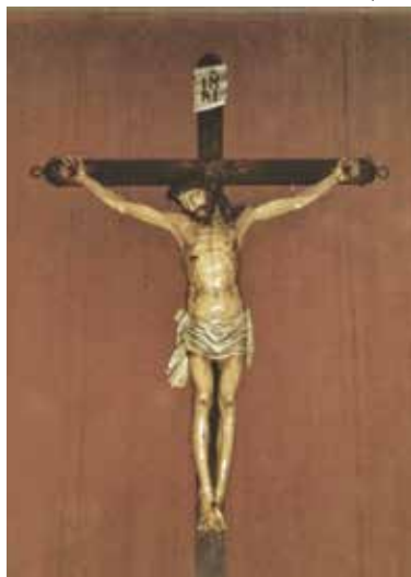
Il Crocifisso del Pilastrello

Nel 1971 la facciata del Pilastrello pericolante a causa delle continue vibrazioni causate dal tram che passava rasente la chiesetta, fu arretrata di circa 2 metri (secondo accorciamento dell'oratorio dopo quello di 3 metri del 1791 voluto dal governo austriaco) e la croce, durante tali lavori fu ricoverata in Santa Maria Nascente, riportata al Pilastrello nello stesso anno e appesa sulla parete a Sud. Nel 1981, in considerazione delle cattive condizioni dell'antico Oratorio, don Carlo Buzzi parroco del tempo, preoccupato per la sorte dell'antico e pregevole manufatto, lo trasferì nella parrocchiale.