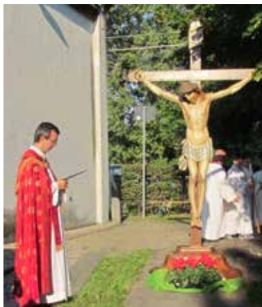
Processione del 24 settembre 2014