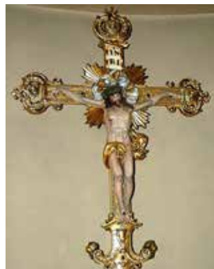
I Crocifissi di Cassina Amata , chiesa di S. Ambrogio